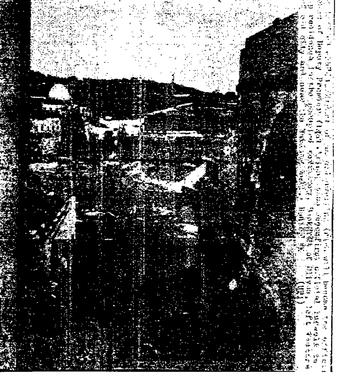
صورة لاسكنية من اليونان بريس للمزول الذي سيستعمله رجال اوسرائيل داخل سور القدس وهو في الصورة الى اليمين. وفي اليسار يرى الحرم القدسي الشريف الذي يحفر الاسرائيليون جداره بحثا عن الهيكل المزعوم